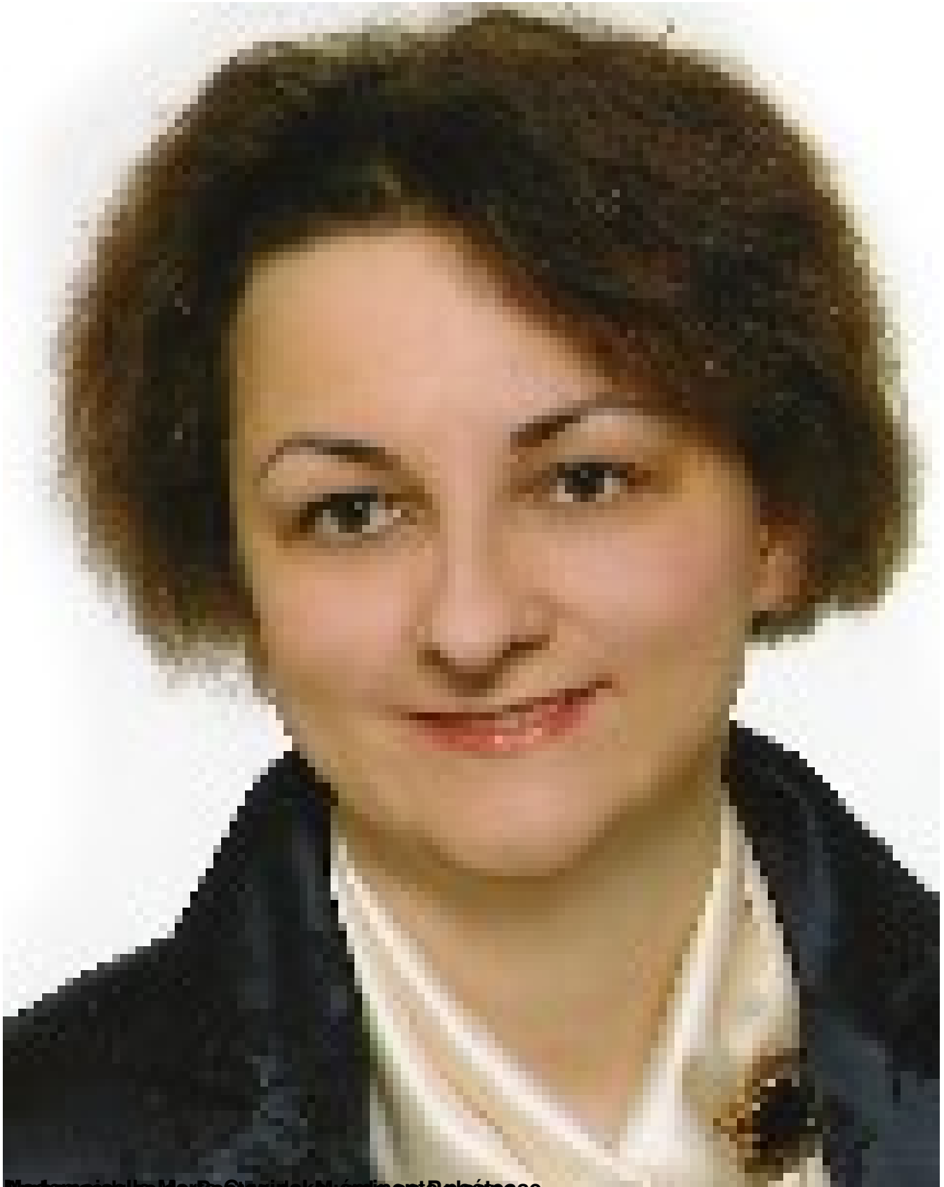
Madame de la Mer Poète du monde en Polésie,