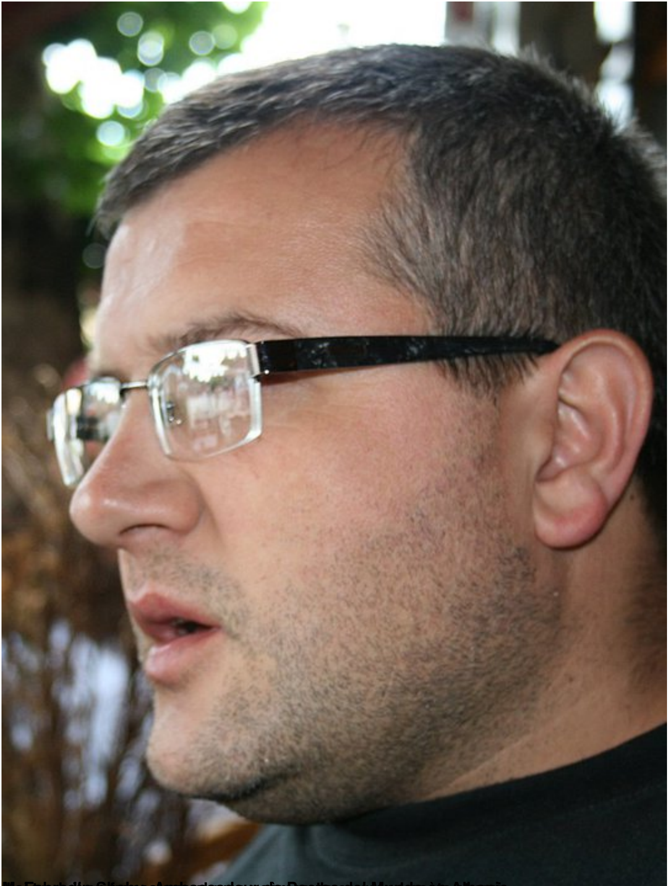
Ma Fiancée et son frère, les deux frères de Poetas del Mundo que je connais