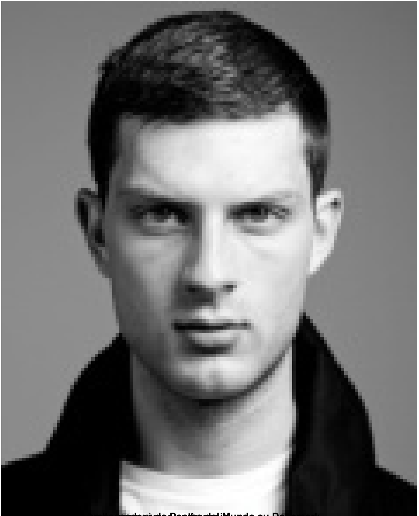
Un poète du monde au Danemark