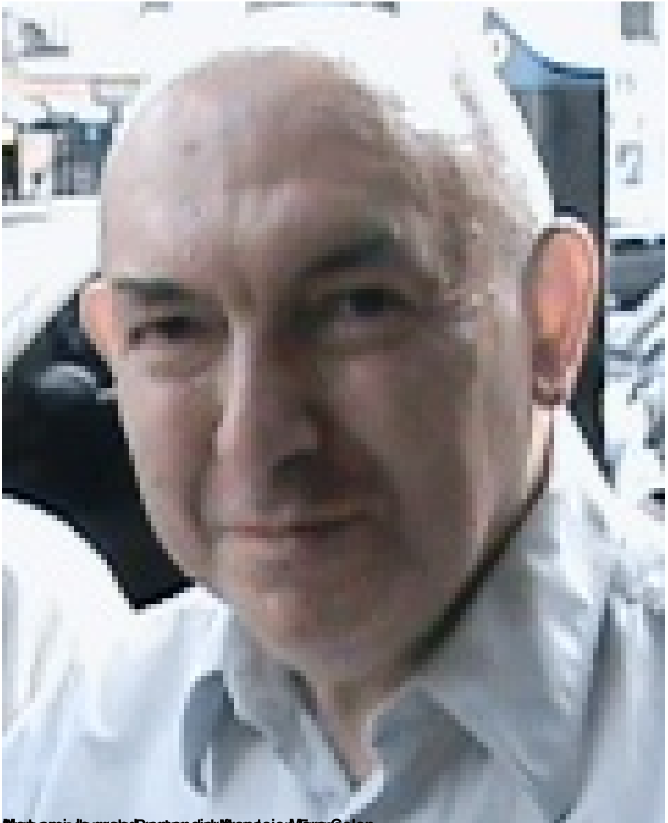
Albassia de grade Poetas del Mundo en Marrakech, Maroc