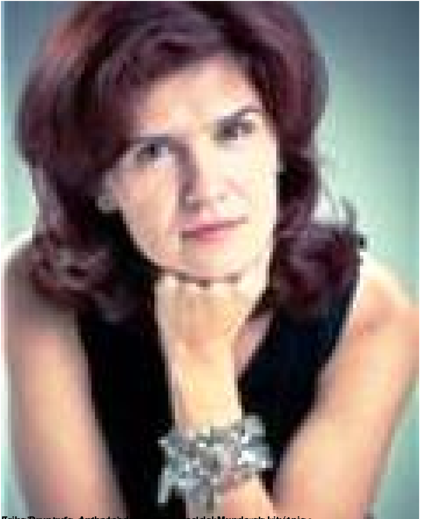
Beisa Breytia, Ambassadrice de la République de Moldova en République de Lituanie