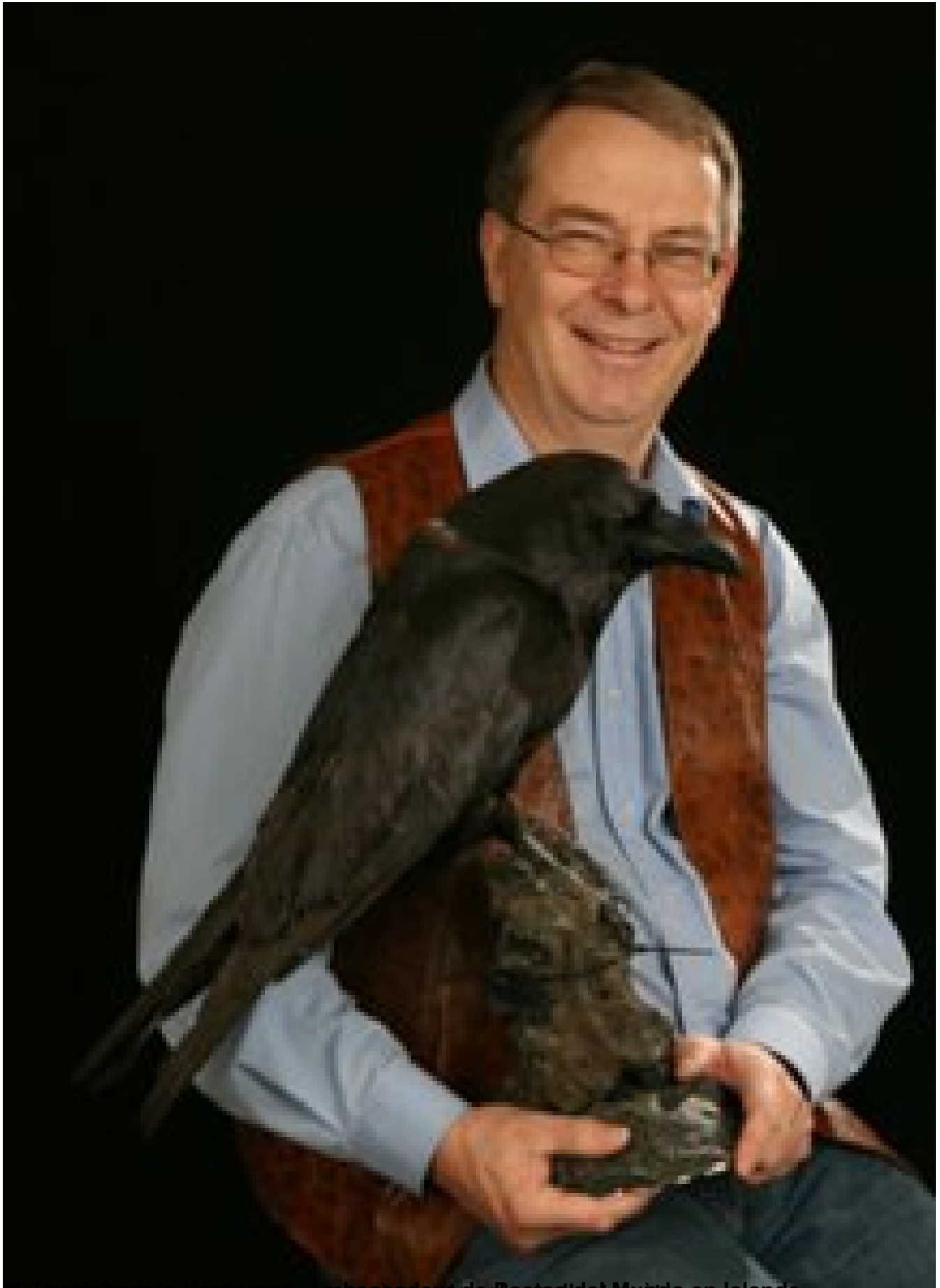
Un traducteur en français qui a passé ses vacances à Reykjavik en Islande