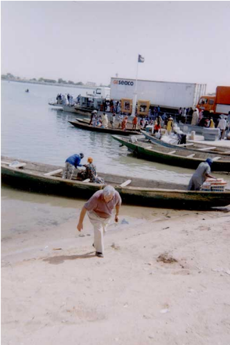
Au fleuve Sénégal