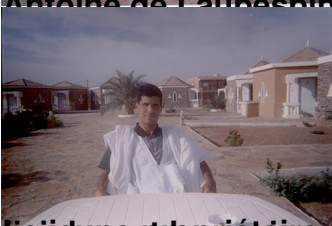
(le jeune propriétaire des hôtels 'Marrakech' à Atar (Mauritanie))