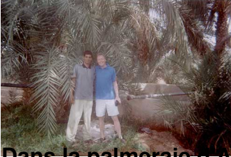
Dans la palmeraie d'Azugui