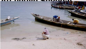
Moi devant le fleuve Sénégal